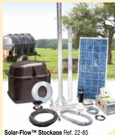
Solar-Flow™ Stockage Ref. 22-85