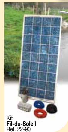
Kit Fil-du-Soleil Ref. 22-90